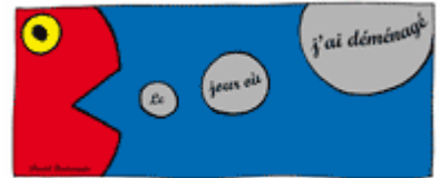
Éditions du Tréc de Neiz